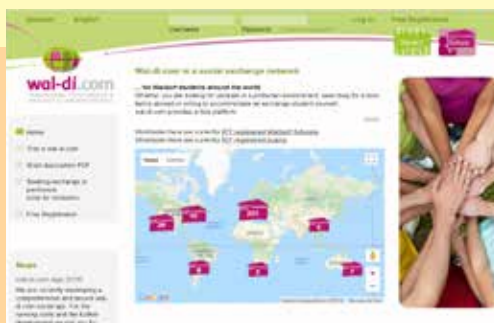
Plataforma digital Wal-di.com

Também neste ano, quatro alunas do nosso Ensino Médio vão descobrir outros mares por meio de contatos feito pela plataforma.